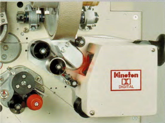
Lecteur de son inversé